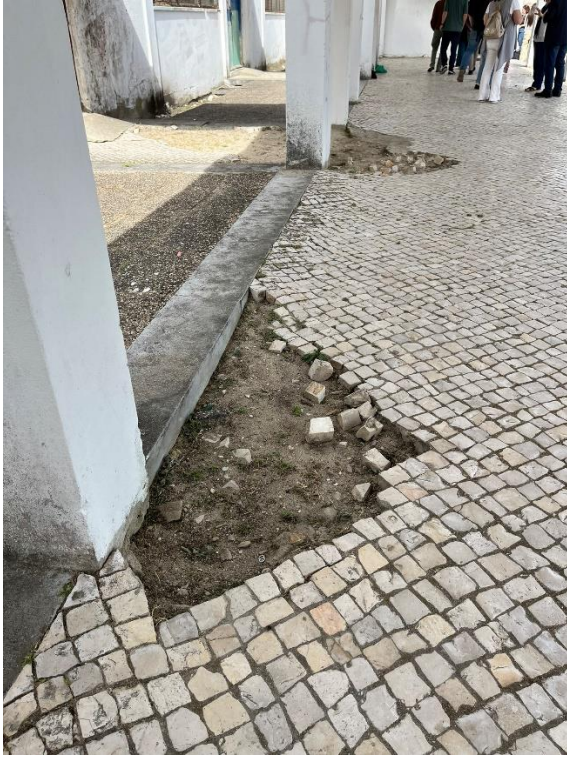
Fotografia 9 e 10: Pavimentos e tampa de coletor.