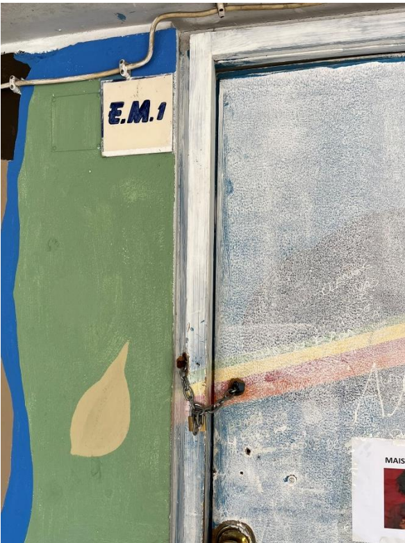
Fotografia 2: Portas fechadas com cadeado e correntes