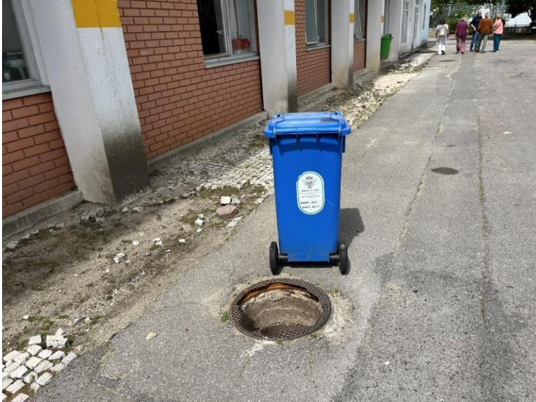
Fotografia 11 e 12: Pavimentos e tampa de coletor.