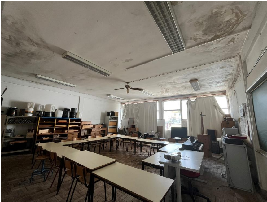
Fotografia 3 e 4: Sala de aula. (Paredes e tetos estado avançado de degradação)