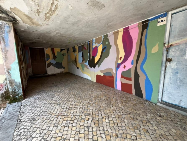
Fotografia 1: Acesso às salas (tetos com está avançado de degradação)