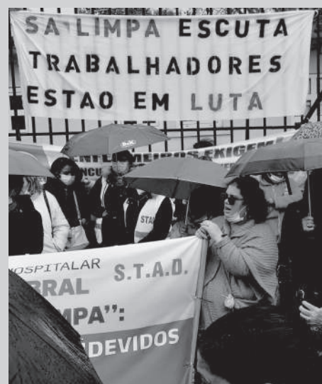
Greve de 7 dezembro 2021 - no hospital Curry Cabral

Esta é aprova que a união faz a força, e que a acção dos sindicatos, se constrói da base.