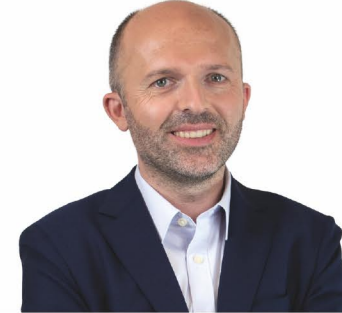
Pedro Ventura candidato à Presidência da CÂMARA MUNICIPAL DE SINTRA