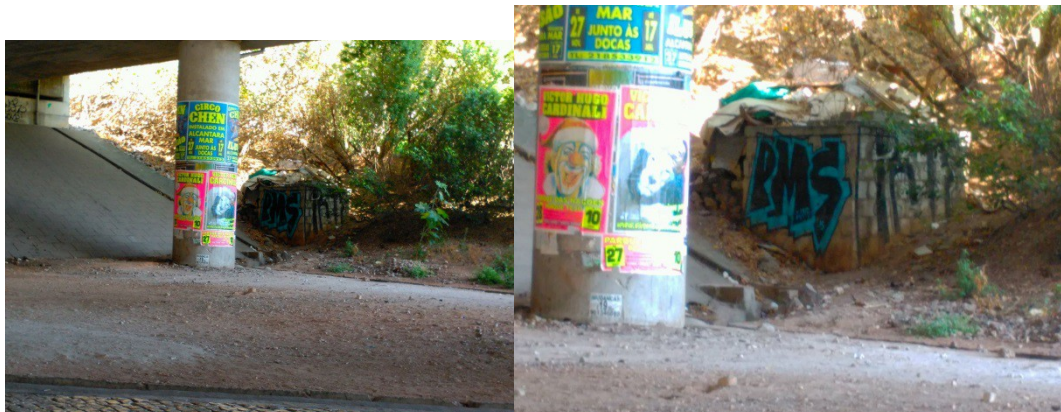
Rua General Alves Roçadas

Em primeiro lugar gostaríamos de saber se a Câmara tem um levantamento destas situações?