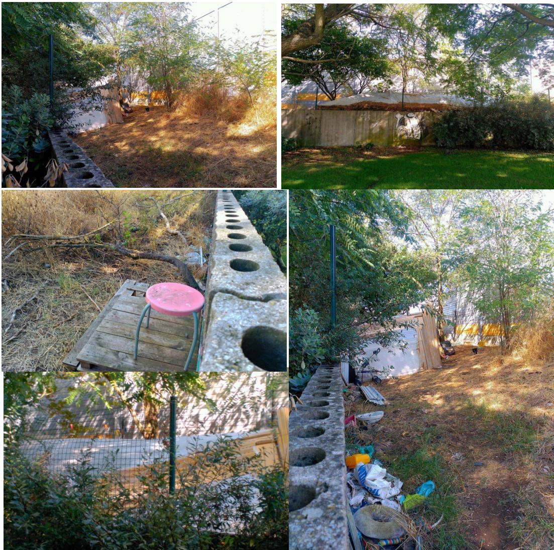
Rua João Santarém

Referimo-nos a uma situação na Rua João Santarém no Chapim, cujo e-mail que identifica a situação foi enviado ao Senhor Presidente em Abril, de uma situação na Estrada Nacional 250 (a seguir a rotunda dos candeeiros) e de uma situação na Rua General Alves Roçadas (por baixo do viaduto do metro), cujas imagens apresentamos: