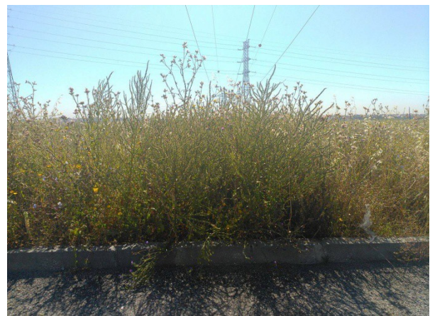
Parque Bio saudável - assim também estas árvores morrerão Um dos passeios lateral ao Pavilhão