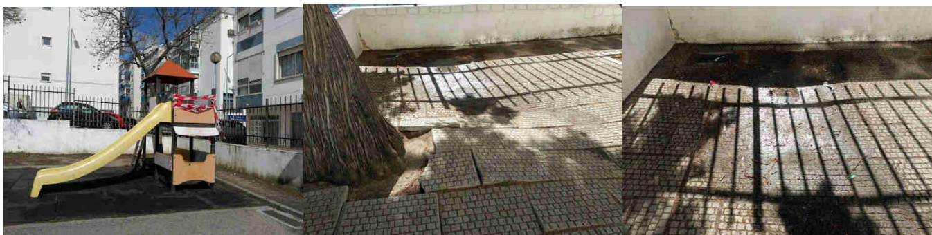
Espaço exterior – brinquedo e piso degradados