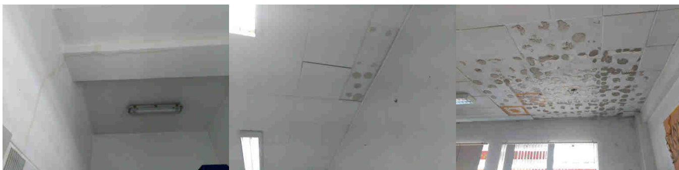
Tetos de salas de aula com infiltrações e placas a cair e retiradas para proteger os alunos