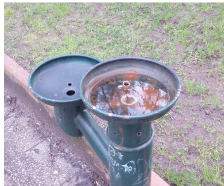
Fotos: chafariz avariado

Em terceiro lugar referir que nos foram feitas perguntas sobre: