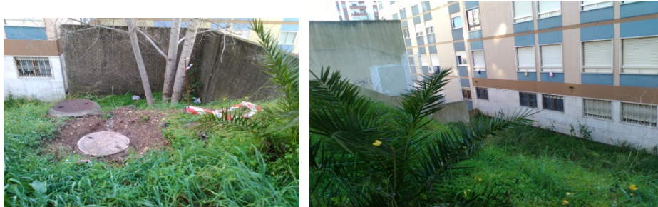
Fotos: terreno em declive

V - Existe um terreno em declive na Praceta da Rua José Gomes ferreira em situação de perigo por obras realizadas nos “colectores” com remoção das terras. Acresce a necessidade de serem colocadas vedações de protecção.