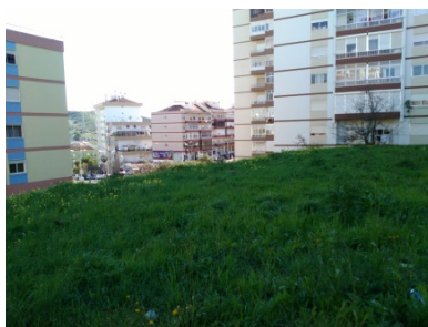
Foto: terreno na Alameda Poder Local

II – A existência de um imóvel que se destinava a ser um Silo Automóvel e que se encontra devoluto há dezenas de anos na Praceta da Rua José Gomes Ferreira com a escadaria de acesso à Rua Egas Moniz. A CDU no passado e perante a informação dos fins a que este imóvel se destinava, sempre colocou a necessidade da existência de criação de mais estacionamento, com especial ênfase nesta zona da cidade de Odivelas. As respostas então obtidas foram dúbias, de que tratava de um projecto privado. Passados todos estes anos, queremos saber, objetivamente qual a situação atual, porque continua fechado e que diligências foram tomadas para saber qual vai ser o futuro destas instalações.