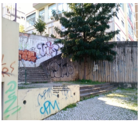
Foto: Escadas de acesso à Alameda do Poder Local

II - Nas Traseiras do IEFP/ Junta de Freguesia podemos observar o estado de degradação e de falta de limpeza.