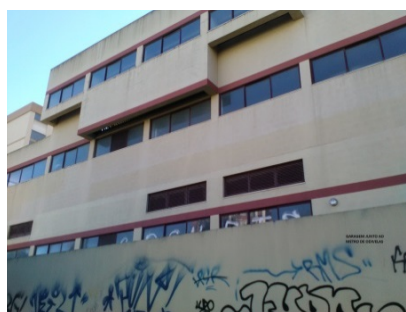
Foto: imóvel devoluto há décadas

II – A existência de um imóvel que se destinava a ser um Silo Automóvel e que se encontra devoluto há dezenas de anos na Praceta da Rua José Gomes Ferreira com a escadaria de acesso à Rua Egas Moniz. A CDU no passado e perante a informação dos fins a que este imóvel se destinava, sempre colocou a necessidade da existência de criação de mais estacionamento, com especial ênfase nesta zona da cidade de Odivelas. As respostas então obtidas foram dúbias, de que tratava de um projecto privado. Passados todos estes anos, queremos saber, objetivamente qual a situação atual, porque continua fechado e que diligências foram tomadas para saber qual vai ser o futuro destas instalações.