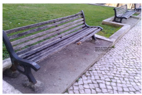
Foto: bancos degradados

III - Na Rua Egas Moniz, frente ao Metro de Odivelas encontram-se bancos de jardins muito degradados.