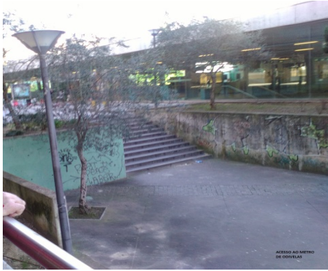
Foto: Acesso ao Metro de Odivelas

V - Existe um terreno em declive na Praceta da Rua José Gomes ferreira em situação de perigo por obras realizadas nos “colectores” com remoção das terras. Acresce a necessidade de serem colocadas vedações de protecção.