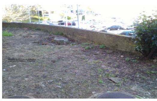
Fotos: Traseiras do IEFP

III - Na Rua Egas Moniz, frente ao Metro de Odivelas encontram-se bancos de jardins muito degradados.