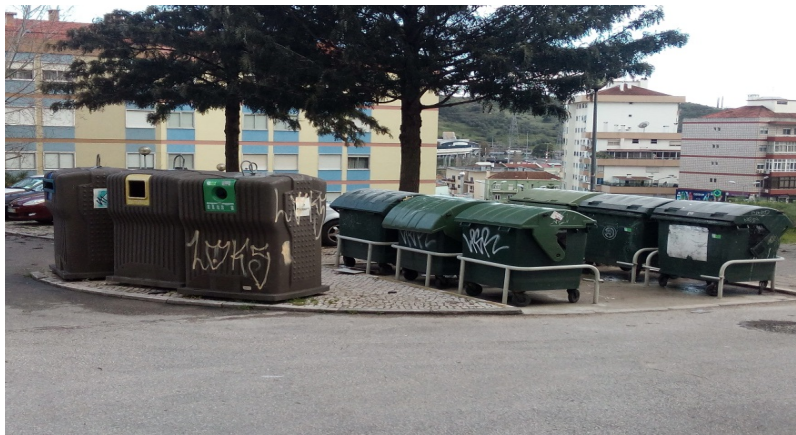
Foto: A nova localização dos contentores

Em primeiro lugar quero valorizar o facto de ter sido possível ir ao encontro das justas reclamações dos moradores da Rua Gomes Ferreira lote 22 que reclamavam a alteração da localização dos contentores dos resíduos sólidos do local por razões que fundamentaram pedido de reunião aos vereadores da CDU e que justificaram as diversas diligências que fizeram junto do então SMAS de Loures, da Junta de Freguesia e da CMO. Fundamentos que justificaram que os vereadores da CDU tenham apresentado um conjunto de recomendações na reunião de CMO de 26 de Junho de 2014 visando dar satisfação a esta pretensão dos moradores.