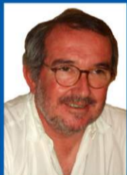
JAIME LOFF ARQUITECTO EGEAC