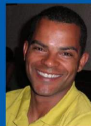
VITOR SANTOS CANTONEIRO LIMPEZA JF SVICENTE