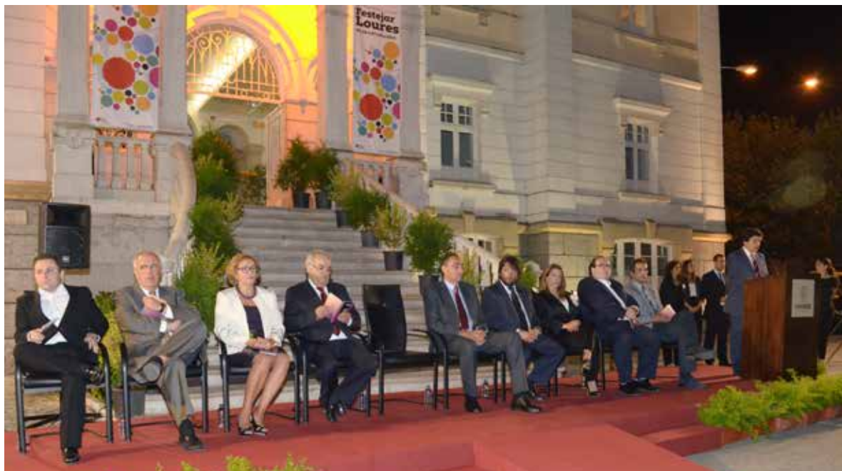
Sessão solene de entrega das condecorações municipais