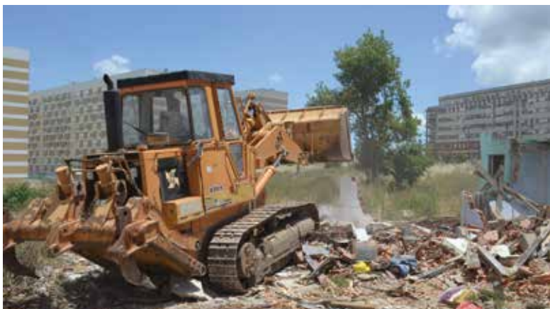
Demolição das últimas barracas na Quinta da Vitória, Portela

Depois da Quinta da Serra, na União de Freguesias de Sacavém e Prior Velho (em janeiro), a Quinta da Vitória foi o segundo bairro de barracas do concelho a ser erradicado nos últimos meses. Em fase de resolução encontram-se, ainda, os bairros da Torre e do Talude Militar, ambos na União de Freguesias de Camarate, Unhos e Apelação.