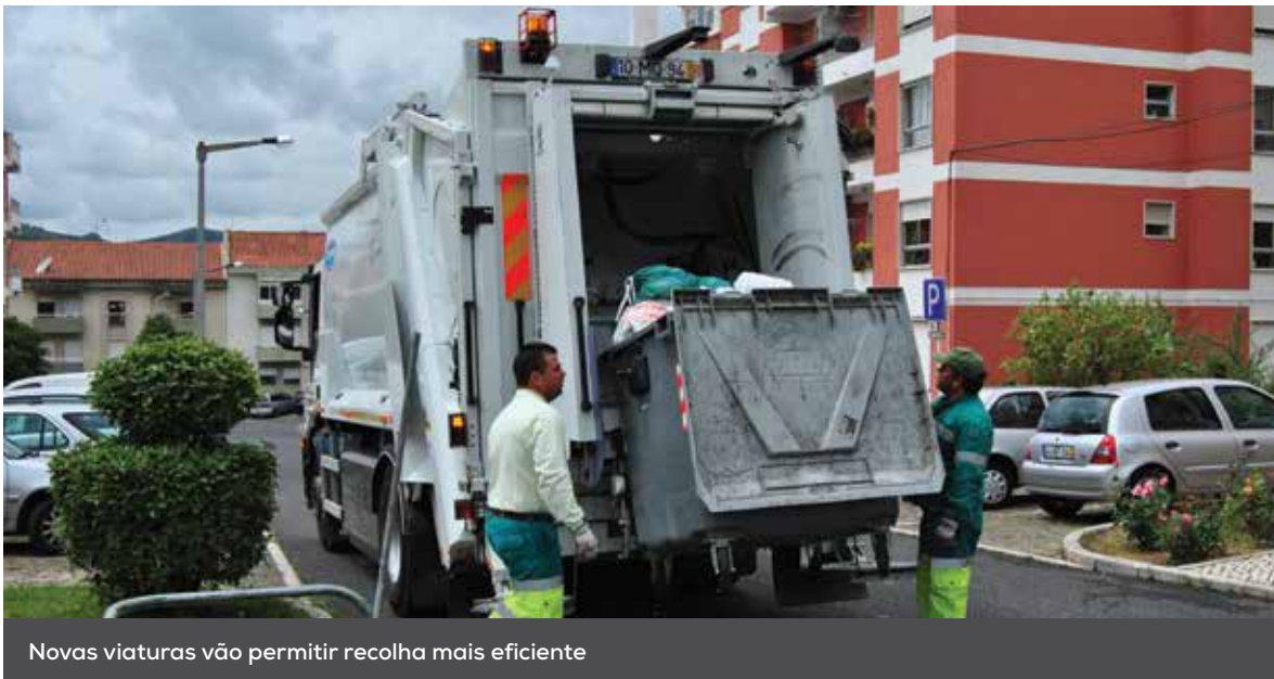
Novas viaturas vão permitir recolha mais eficiente

Reformulação dos circuitos, contratação de mais funcionários e aquisição de novas viaturas são a resposta do Município aos problemas verificados na recolha de resíduos sólidos urbanos.