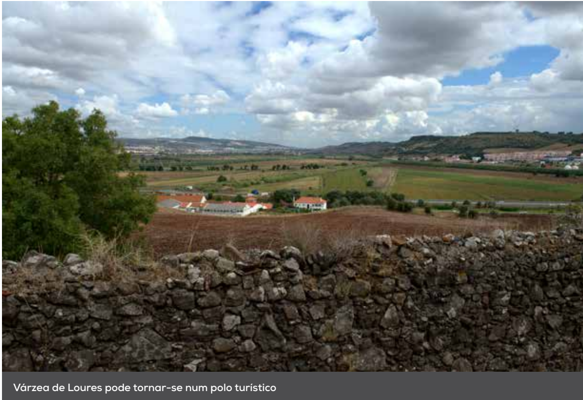
Várzea de Loures pode tornar-se num polo turístico

O Parque da Várzea e Costeiras de Loures é o retomar de um projeto antigo que visa transformar a várzea num polo de lazer e de atração turística.