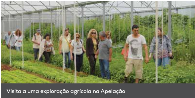
Visita a uma exploração agrícola na Apelação

Encurtar os circuitos de distribuição, consciencializar produtores, empresas e consumidores para a importância do consumo dos produtos locais, valorizando o caminho para a sustentabilidade dos sistemas alimentares foram os assuntos debatidos pelos intervenientes, que tiveram ainda oportunidade para visitar uma exploração agrícola de cariz biológico, na Apelação, assim como o Mercado Abastecedor da Região de Lisboa.