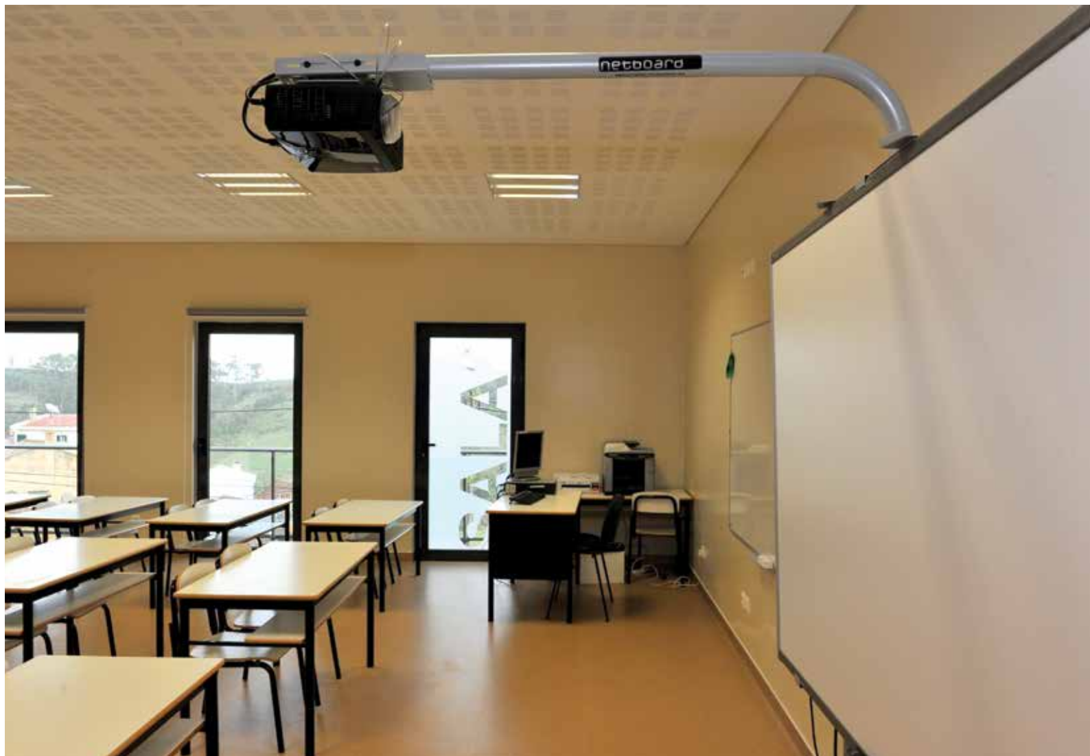
Várias escolas foram reabilitadas