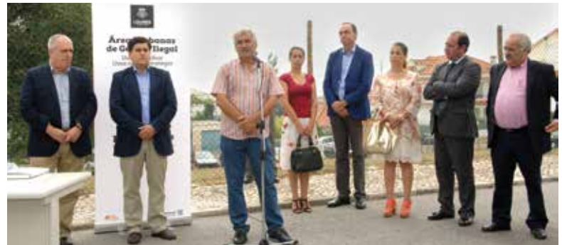
Cerimónia de entrega do alvará de loteamento

a legalização não pode ocorrer apenas no papel. Tem de corresponder à existência de um conjunto de condições que dê qualidade de vida às pessoas que ali vivem.” A sessão continuou com apresentações por técnicos dos municípios de Loures, Seixal, Cascais e Sesimbra, que caracterizaram a situação vivida nos seus territórios, dando exemplos de bairros em reconversão. Foi reconhecido, de forma unânime, que o trajeto percorrido está aquém das necessidades, sendo urgente repensar a criação de novos mecanismos de gestão do território. Atualmente, existem no concelho de Loures 158 núcleos delimitados como AUGI, 118 na modalidade de reconversão por iniciativa particular e 40 por iniciativa municipal. Ao todo, já foram emitidos 56 alvarás de loteamento.