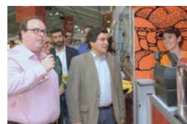
Abertura do festival