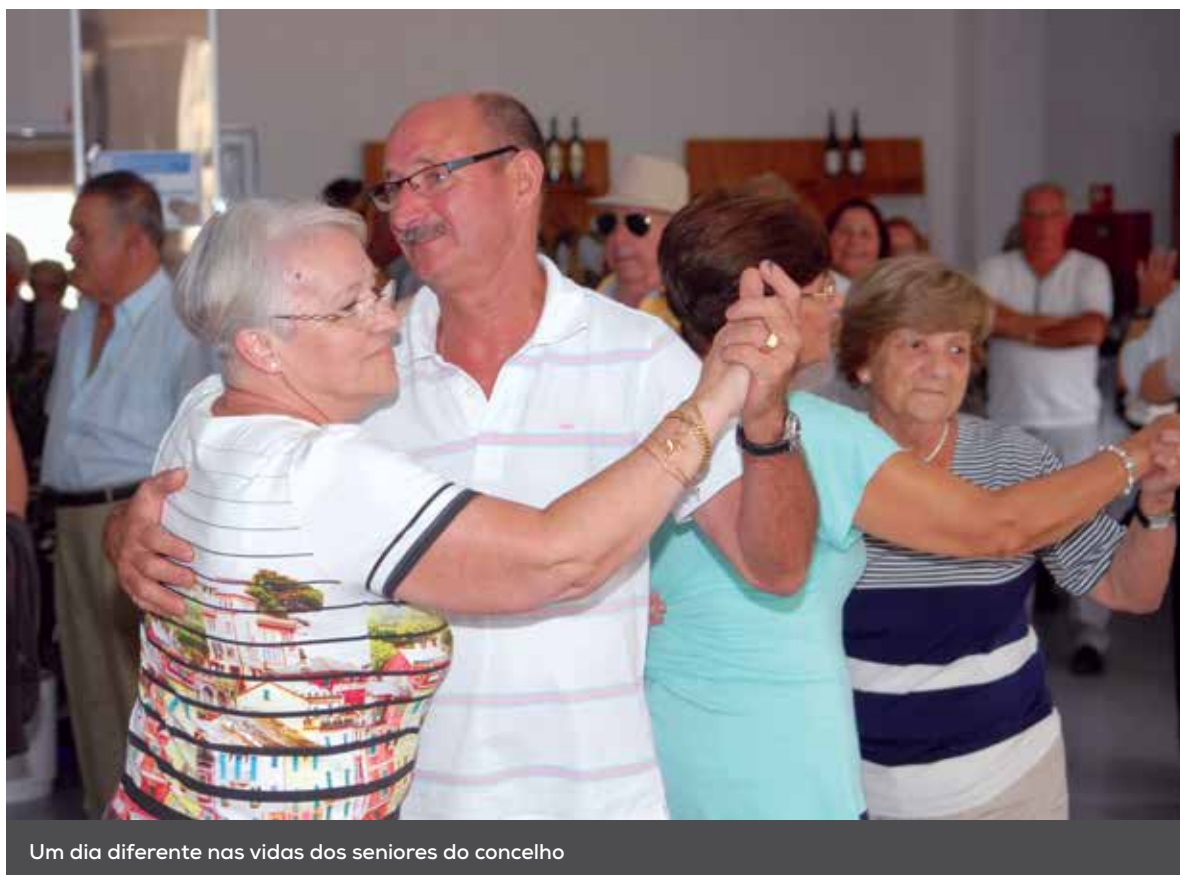
Um dia diferente nas vidas dos seniores do concelho