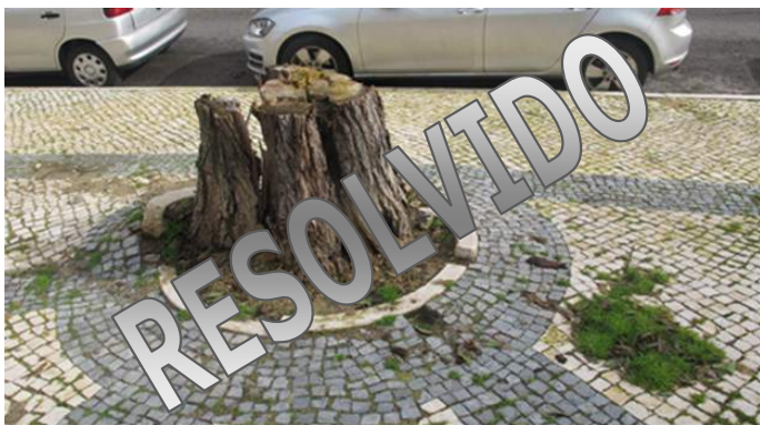
Jardim Luís Ferreira (ao cimo da Av. Coronel Eduardo Galhardo) Abril de 2014