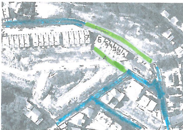
Zonas a Verde sem iluminação Pública

Chegou ao conhecimento dos vereadores da CDU e também aos outros senhores vereadores a reclamação de moradores do Bairro Monte Verde, em Caneças por causa de falta de iluminação na Rua Serpa Pinto, conforme as fotos o ilustram.