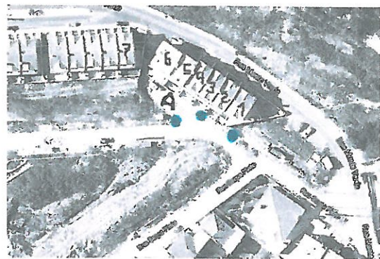
Arruamento A e Localização do Poste de iluminação que não estão ligados

Esta situação, dizem os moradores e facilmente se compreenderá, causa alguma insegurança porque é precisamente do lado da entrada das garagens, faz um recanto que se torna perigoso.