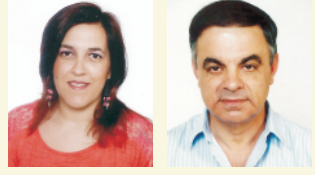
Carla Claré Op. de Caixa Calhandriz Orlando Girardim Mecânico Alhandra