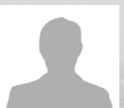
António Sameiro Empresário (Caxias)