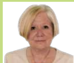
Fátima Canavezes Reformada (C. Quebrada/Dafundo)