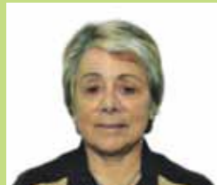
Etelvina Reis Ferroviária (Algés)