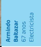
Armindo Baltazar 67 anos Electricista