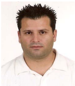
Rui Braga S.G.G.P - Stª Iria de Azóia