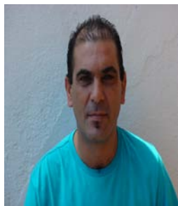
Armando Luzes S.G.G.P - Stª Iria de Azóia