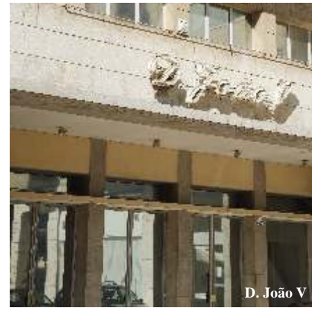
D. João V

O Cinema D. João V é mais um equipamento da Câmara Municipal abandonado e a degradar-se há anos, por incúria, e porque o PS não tem interesse pela cultura. A população e a CDU, numa concentração em frente ao D João V e com a recolha de mais de 1000 assinaturas, exigiram a sua reabertura. Trata-se de um espaço onde se fizeram iniciativas de grande qualidade, ao tempo da maioria CDU e que pode voltar a ser um pólo cultural na Damaia.